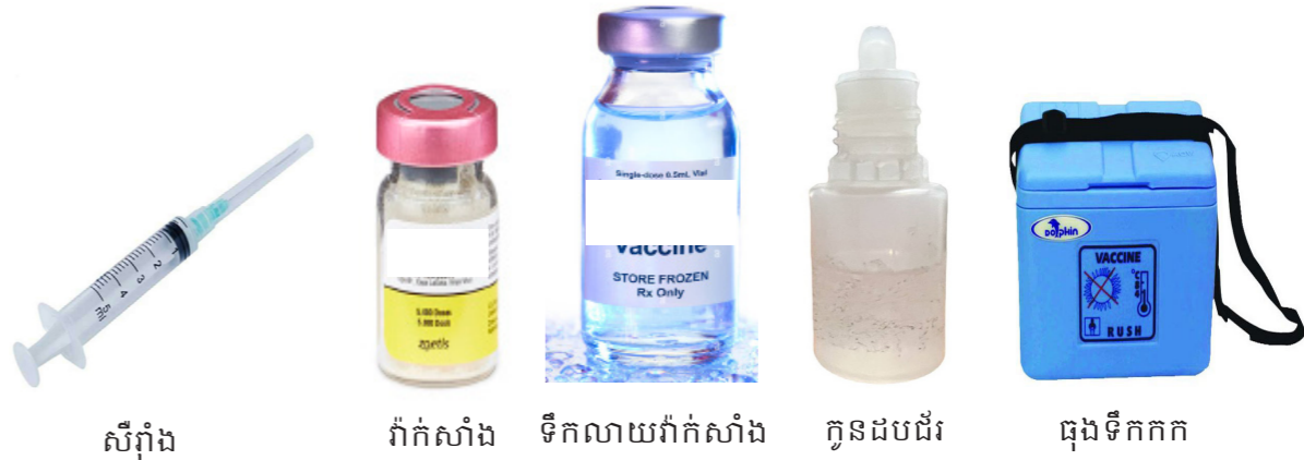
ស៊ីរ៉ាំង វ៉ាក់សាំង ទឹកលាយវ៉ាក់សាំង កូនដបជ័រ ធុងទឹកកក